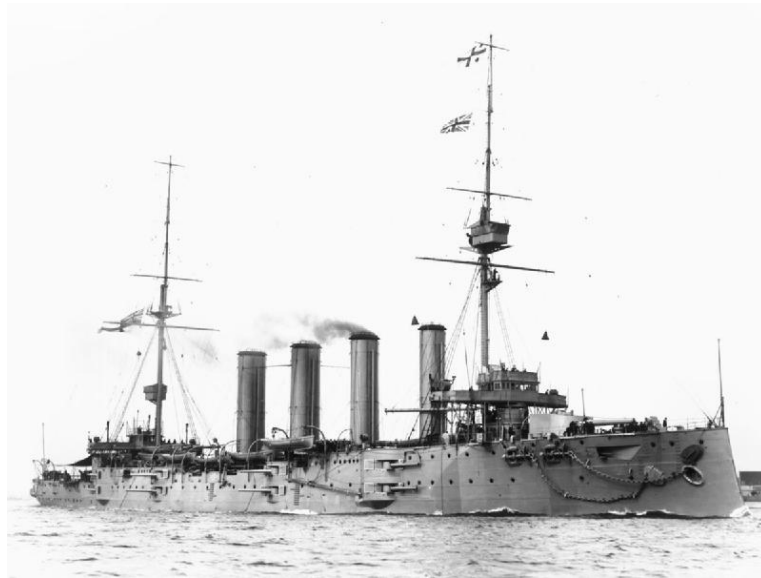
3. Imagen del buque insignia del almirante Craddock en la Batalla de Coronel, el crucero acorazado "HMS Good Hope".